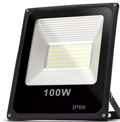
Figura 01 – Refletor de LED 100W.